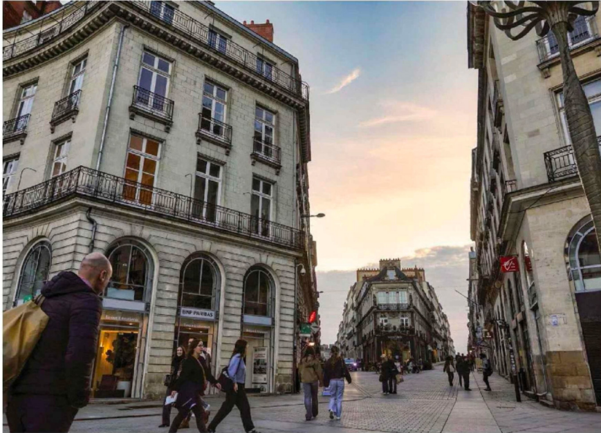
Temps d'arrêt. Les appartements du centre-ville, comme ici rue Voltaire, voient leurs ventes stagner depuis la fin du confinement.

Immobilier. La chute des prix et des transactions ralentit un peu.