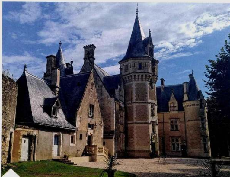
Dans la Sarthe, ce château des XVI e et XIX e siècles s'étend sur environ 680 m 2 (23 pièces, 15 chambres), profitant d'un parc à l'anglaise de 25 hectares (2 640 000 €, Cabinet Le Nail).