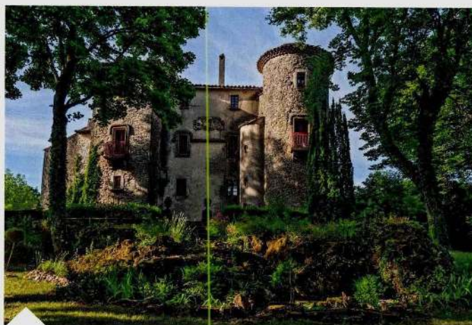
Dans l'Hérault, près de Montpellier, ce château seigneurial du XV e siècle offre 470 m 2 habitables sur 4 niveaux (Barnes, 875 000 €).

volume de nos ventes est assez stable par rapport à celui de 2023 (environ -1%, là où d'autres annoncent des baisses records), il concerne principalement le milieu rural, où le prix moyen d'une propriété s'élève à 845 000 euros, contre 935 000 euros pour les zones urbaines. Même si la France est l'un des pays qui compte le plus de châteaux, ce qui fait leur valeur, historique, sentimentale, patrimoniale et financière est leur rareté, leur caractère unique », estime Stéphane Aguiraud, président du groupe Immobilier Mercure France.