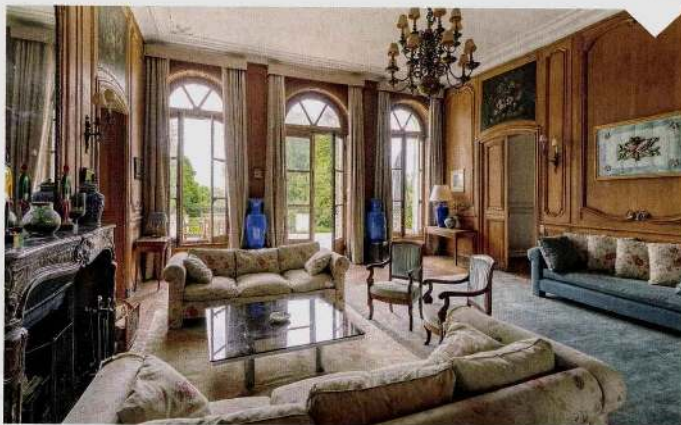
Au sud de Meaux, Daniel Féau commercialise ce château de 850 m 2 , (4,20 m), au cœur d'un parc de 18,5 hectares (1 700 000 euros).