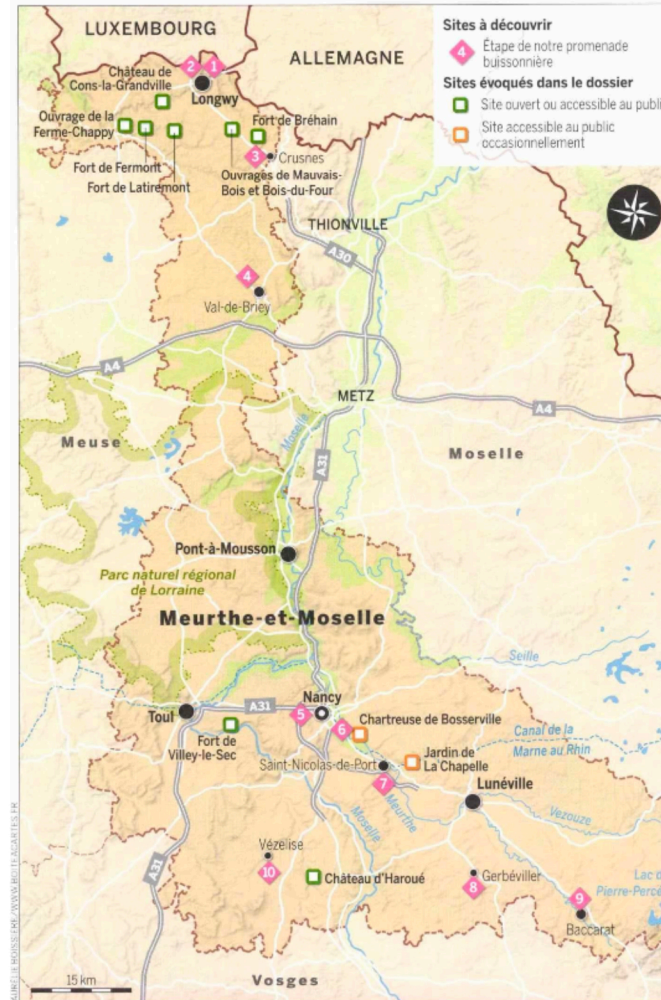
Sur la carte ci-dessus ne figurent que les lieux, sites et édifices mentionnés dans les articles du dossier et de la promenade buissonnière.

À l'origine, la somptueuse façade Renaissance du château ornait l'hôtel particulier de Ferdinand de Lunati-Visconti. Lorsque ce descendant de l'une des plus vieilles